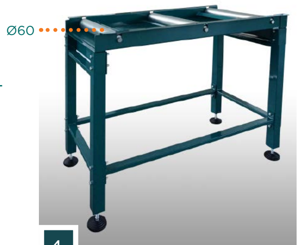
Modulare Bahnen Gerätetyp "A":