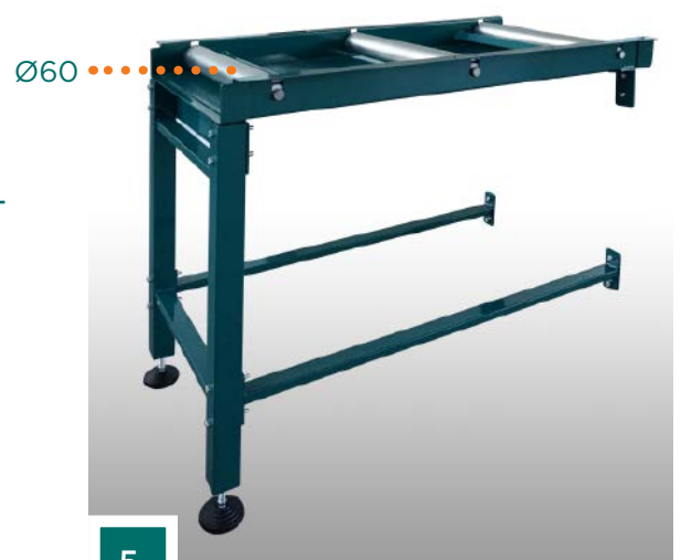
Modulare Bahnen Gerätetyp "B":